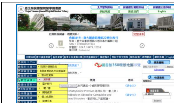
1【臺北榮總圖書館首頁】

連結路徑： 臺北榮總圖書館首頁 →數位資源 (頁面左方)→資料庫→ 數位資源整合查詢系統 (請輸入 email 帳號)→A to Z 瀏覽或搜尋該資料庫。請參考下圖。