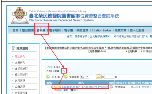
2【數位資源整合查詢系統】