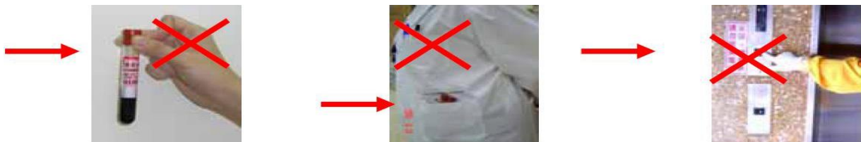
① 直接用手接觸檢體