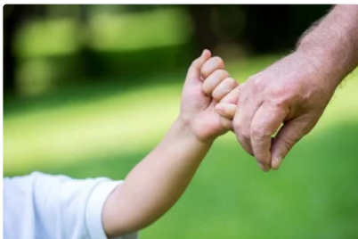
殺蟲劑宣稱能防疫 聯邦要求亞馬遜、eBay下架