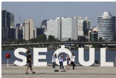
逾60歲長者確診人數驟升 韓防疫部門憂老人死亡率增加