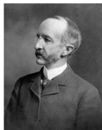
Dr. Edward Livingston Trudeau (5 October 1848 – 15 November 1915)