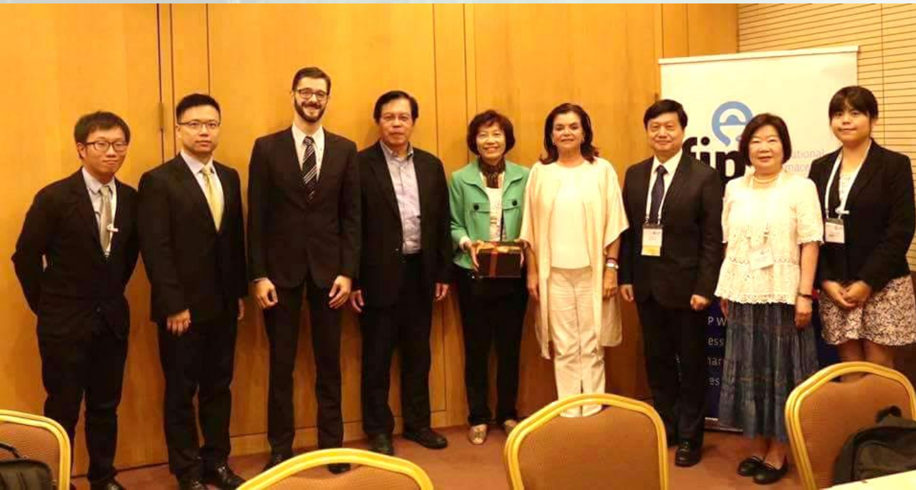
2017 FIP- Seoul