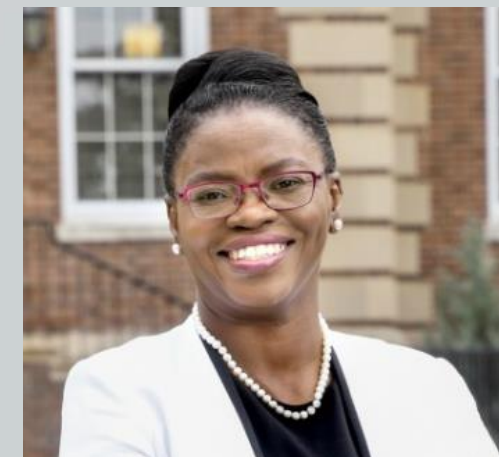
FIP Academic Pharmacy Section主席