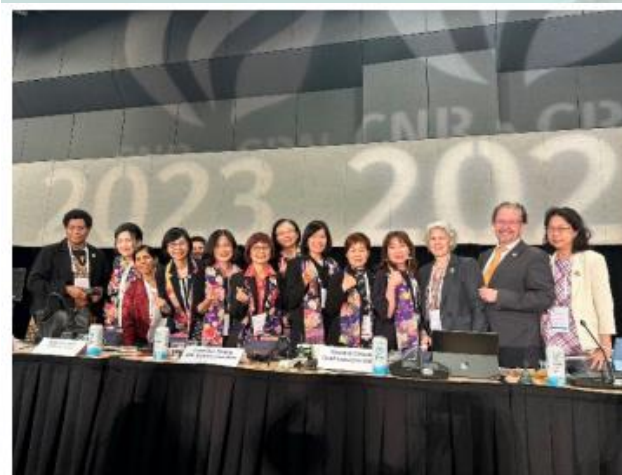
本會代表與 ICN 理事長、第三副理事長、執行長及兩位理事會成員合影