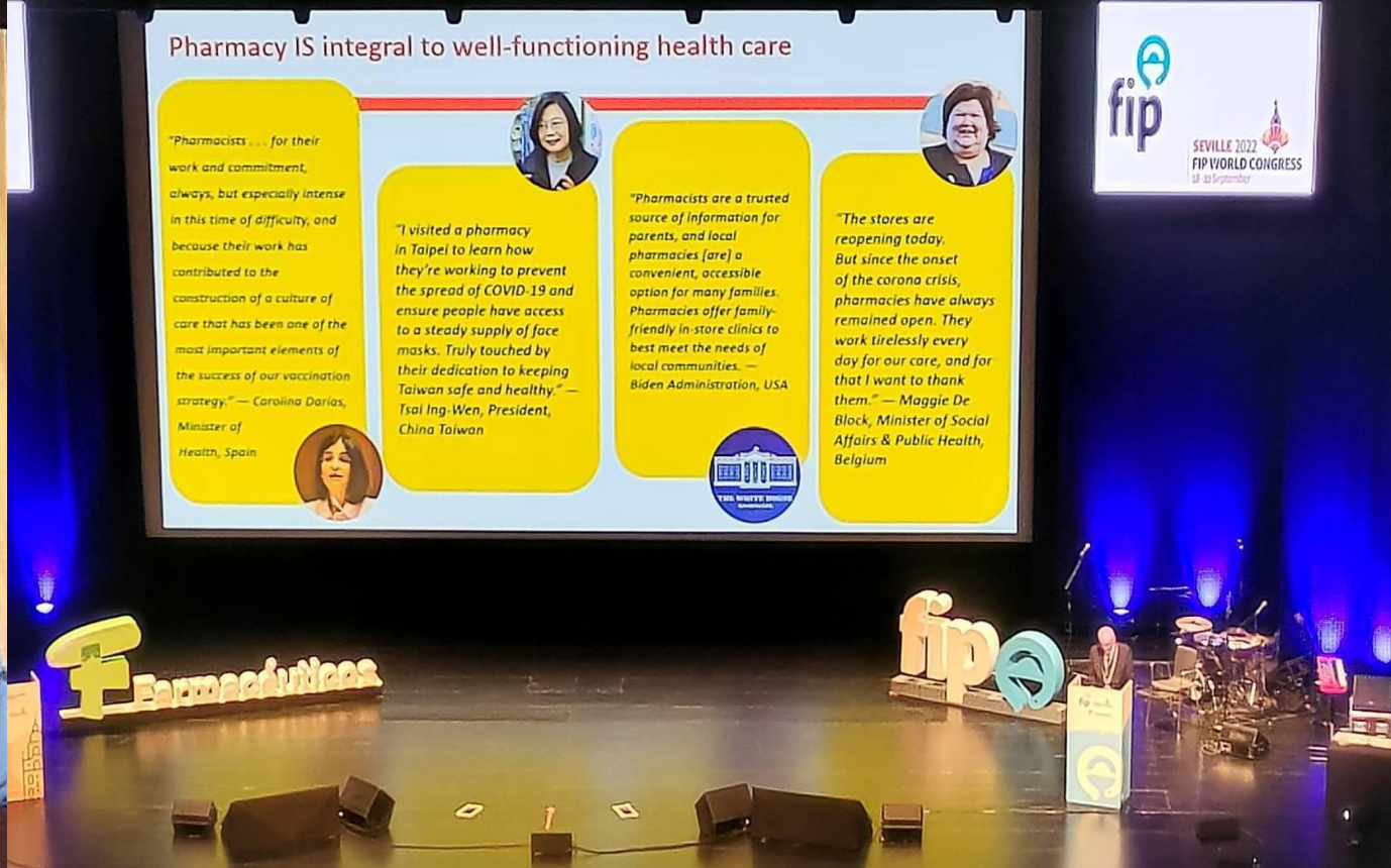
2022 FIP大會開幕式 (西班牙)