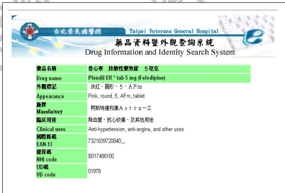
圖 2 搜尋初步結果，點選圖像資料