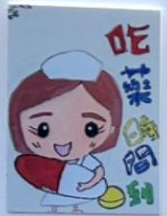
我當護士的時候，繼續工作 廖承恩 廖承恩 廖承恩 廖承恩