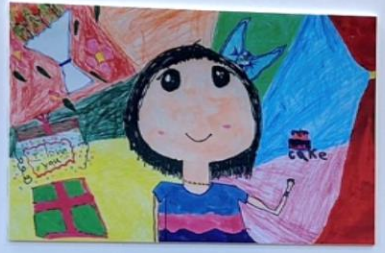
我要我親愛的媽媽 文佩宇 廖承恩 廖承恩