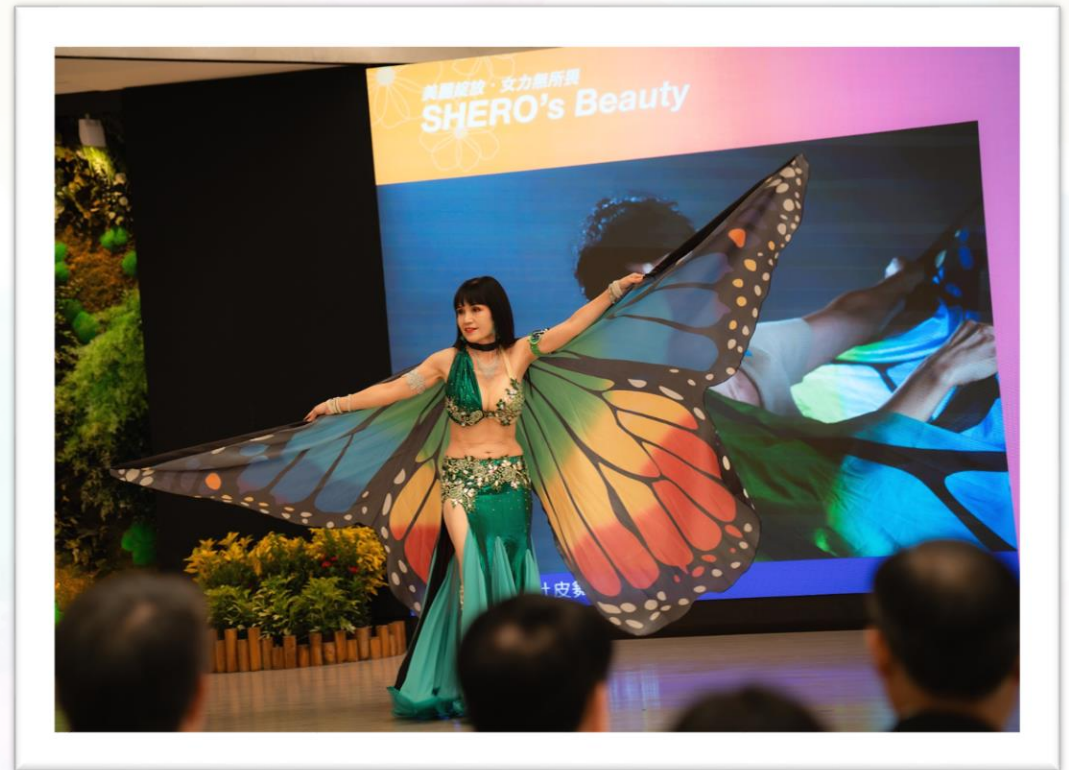
肚皮舞小魚兒老師遭三癌接連來襲 浴火重生，轉念成為最想成為的自己