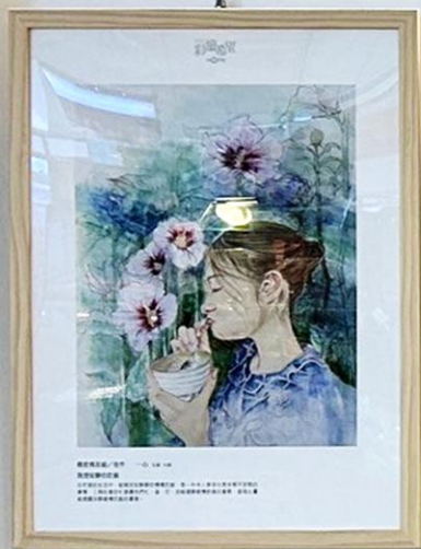
一心-我想安靜的吃飯

在忙碌的生活中，能夠安安靜靜的慢慢吃飯，是一件令人享受也是非常不容易的事情，工商社會的忙碌讓我們忙、盲、茫，忽略健康緩慢飲食的重要，望借此畫能提醒安靜緩慢吃飯的重要。