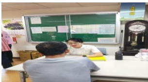
骨質密度檢查/ 護理諮詢