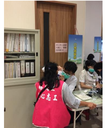
口腔檢查/戒檳宣導