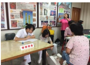
骨質密度檢查/ 護理諮詢