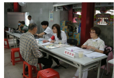
營養、護理、藥物諮詢