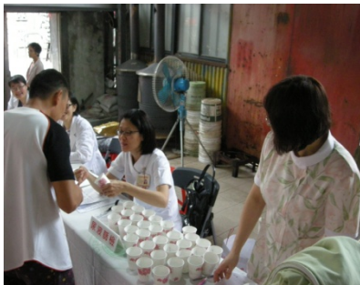
慢性腎臟病篩檢及諮詢