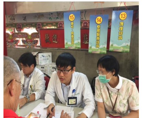
醫療(戒菸、減重)、護理諮詢