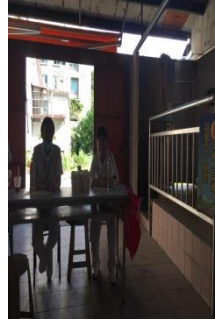
尿液篩檢及 慢性腎臟病諮詢