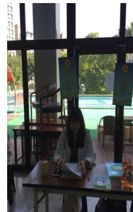
醫療(戒菸、減重)、護理諮詢