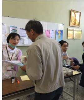
尿液篩檢及慢性腎臟病諮詢