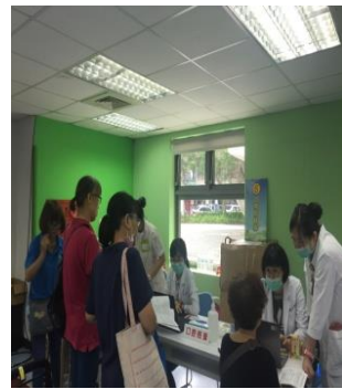
口腔檢查/戒癮宣導