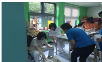
骨質密度檢查/ 護理諮詢