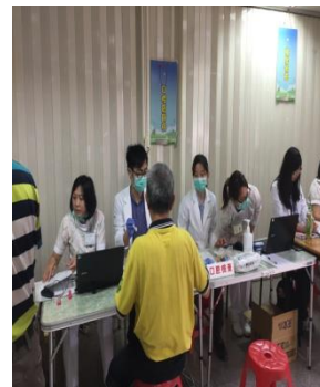
口腔檢查/戒癮宣導