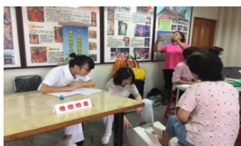
骨質密度檢查/ 護理諮詢